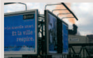
■ JDC Pictures

■ La tendance n'est pas bonne et c'est tout le marché de l'immobilier qui le ressent. Celui qui cherche à s'offrir la maison de ses rêves, c'est le bon moment. Encore faut-il trouver un prêt à la banque... L'idéal est d'avoir un apport en fonds propres.