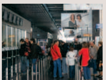
Le tout dans un nouveau terminal. ■ D.G.

■ La morosité ambiante favoriserait-elle la migration de l'homme touristique? On peut légitimement se poser la question au vu des statistiques de fréquentation de BSCA, qui enchaîne les records: + 22 % de passagers alors que les aéroports européens flanchent. Le catalogue "voyages" au départ de BSCA s'est également considérablement étoffé. La palette compte désormais une quinzaine de destinations supplémentaires. En