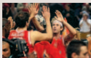
Le sport a le vent en poupe... ■ D.G.

■ Les concessionnaires automobiles de Charleroi offrent pour l'instant des conditions intéressantes, tant pour les véhicules neufs que pour les occasions. En neuf: environ 1.000 € de ristourne supplémentaire. En occasion: entre 10 et 20 % de moins. ■ P.B.