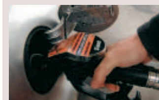
Moins d'un euro le litre de diesel. ■ Lange

■ Plus de transports en commun! On a dépassé le stade du vœu pieux en entamant les travaux du métro. A la mi-2011, tout devrait être terminé. Ça ne plaît pas à tout le monde. Il ne reste pas moins vrai que cela devrait améliorer la mobilité carolo.