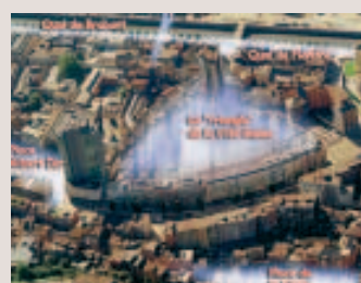
■ Montage M.O.B.

■ Les autorités carolos ont enfin montré leur préférence pour deux projets de promoteurs qui commençaient à perdre patience. Rachats de magasins, de terrains, occupations par de nouvelles enseignes: les idées des promoteurs sont claires dans l'esprit des promoteurs. Voilà qui devrait donner un nouvel attrait à la ville basse. D'autant plus que le projet "Phénix" viendra se superposer en rénovant