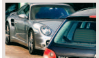
Les voitures sont moins chères. ■ AP

■ Charleroi peut se féliciter de voir la criminalité baisser. Même si tout n'est pas parfait, comme par exemple pour les vols avec violence, on note tout de même une baisse dans les tiger-kidnapping, les "early morning" et les home-jackings.