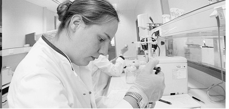
Recherches en laboratoire

UDIAS Tél : + 32 2 481 00 50 Fax : + 32 2 463 17 06 E-mail : laborama@udias.be Web : www.laborama.be